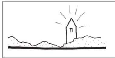
hoge gebouwen in de randen werken als oriëntatiepunten in de openheid