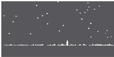
verlichte plekken in de randen versterken het donkere middengebied