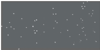
donkerte, zicht op de sterren bij nacht