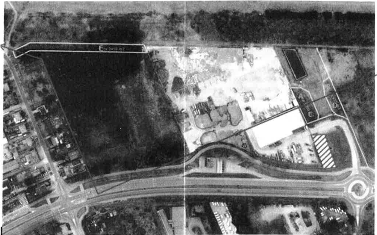
Figuur: Luchtfoto met komgrens Boswet (rode lijn) met te vellen houtopstanden (A t/m E) en compensatiegebied voor A t/m D en een klein gedeelte E (blauwe arcering)