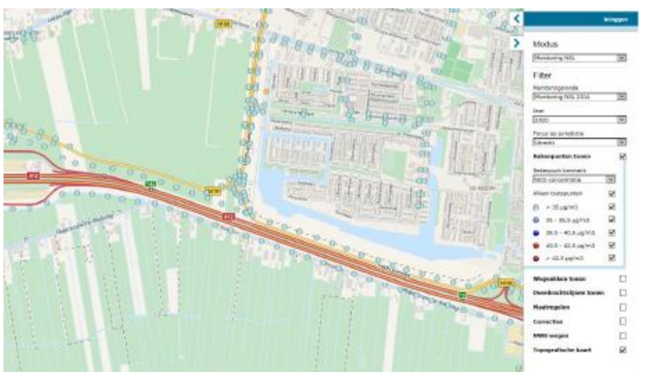
Figuur 4: Jaargemiddelde concentratie stikstofdioxide op toetspunten in 2020