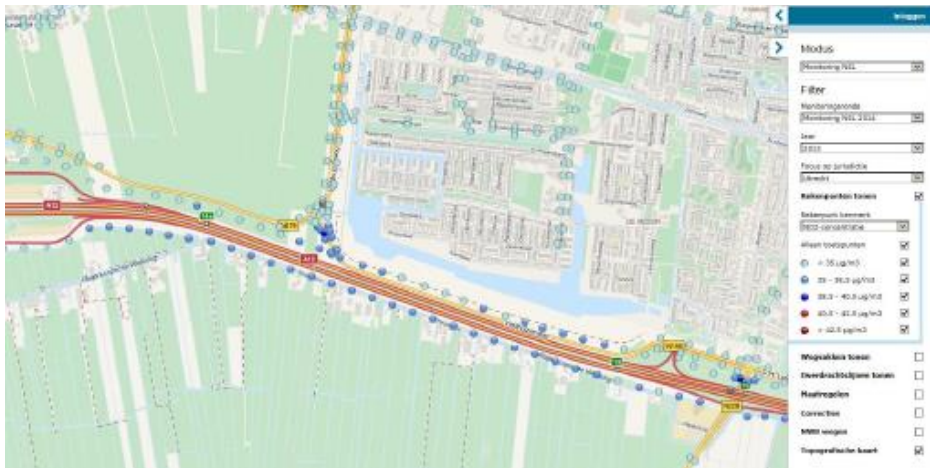
Figuur 2: Jaargemiddelde concentratie stikstofdioxide op toetspunten in 2013

Veldhuizerweg, alsmede langs de N419 in alle jaren (2013, 2015 en 2020) voldaan wordt aan de jaargemiddelde concentratie voor stikstofdioxide.