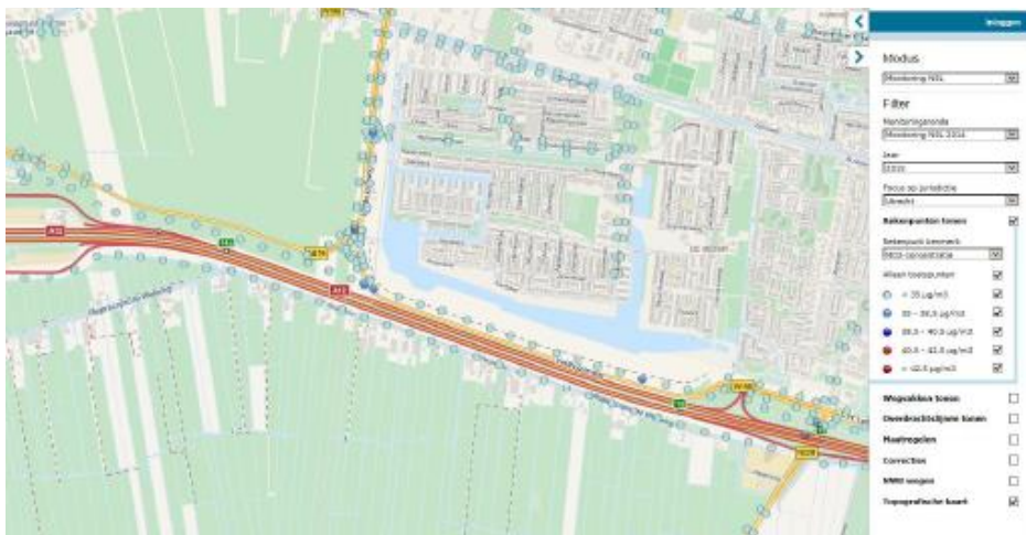
Figuur 3: Jaargemiddelde concentratie stikstofdioxide op toetspunten in 2015