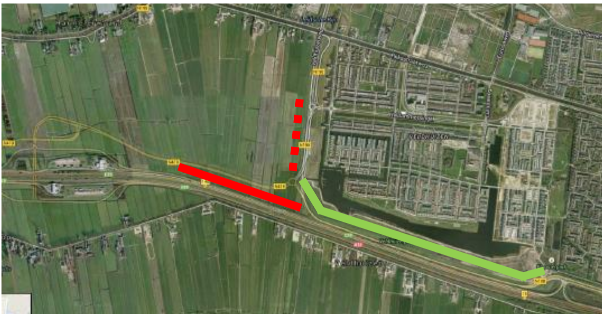
Figuur 1: Situering geluidswal Veldhuizen (groen = reeds bestaande geluidswal, rood = nieuw te realiseren geluidswal, rood gestippeld = alternatieve variant voor te realiseren geluidswal)

In het onderstaande (Google Maps) luchtaanzicht is de huidige situatie weergegeven. Tussen de op- en afrit van de A12 en de N198 is reeds een geluidswal aanwezig (met groen aangegeven). De nieuw aan te leggen geluidwerende voorzieningen komen in het verlengde hiervan (tussen de A12 en de N419) en worden over een lengte van circa 800 lang in westelijke richting gerealiseerd (met rood aangegeven).